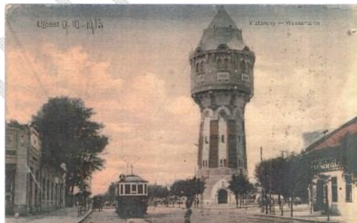
Az újpesti víztorony egy 1913-as képeslapon