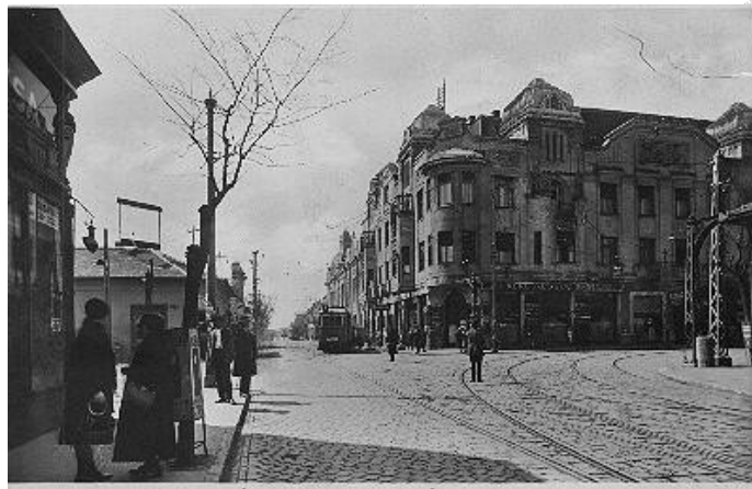
Életkép a régi Újpestről

A város történetének jelentős állomása 1929, hiszen Újpest ekkor nyerte el a megyei jogú város címet. Járásbírósága, villamos erőműve, takarékpénztára, sportlétesítményei, oktatási intézményei, zeneiskolája, számos bejegyzett egyesülete és kereskedelmi egysége, 38 ipari vállalata van, amelyek közül sok országos jelentőségű (pl.: Wolfner Bőrgyárak, Chinoin, Egyesült Izzó).