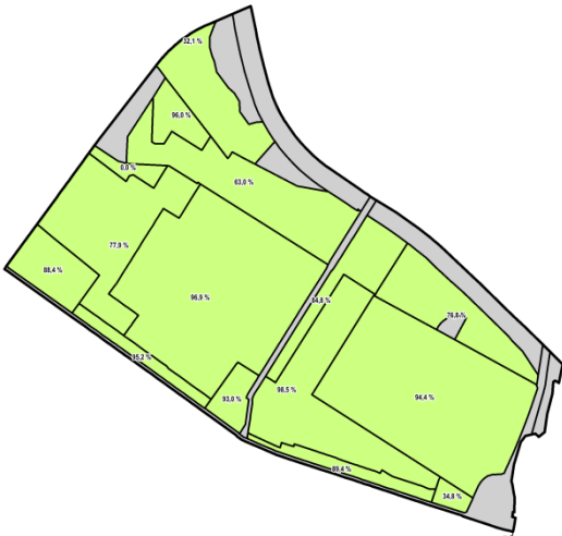
Az általános szintterületi mutató értékének igazolása

A szürke szín jelzi azokat a területeket, ahol a terület beépítésre nem szánt területfelhasználási kategóriába sorolt, vagyis ahol nincs meghatározva az FRSZ-ben Bsa érték.