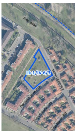
Az érintett övezet elhelyezkedése Északi kertváros városzerkezeti egységben (légifotó)