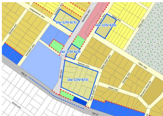
Az érintett övezetek elhelyezkedése Északi kertváros városzerkezeti egységben (övezeti struktúra)