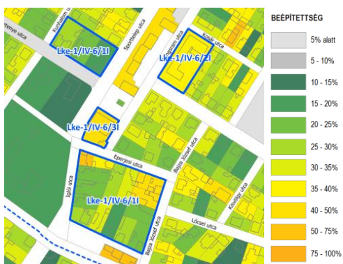
A megalapozó vizsgálat szerinti, kialakult beépítési mérték az érintett övezetek területén