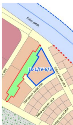
Az érintett övezet elhelyezkedése Északi kertváros városzerkezeti egységben (övezeti struktúra)

Tekintettel arra, hogy az ezredforduló környékén beépült terület mind városzerkezeti, mind településarculati szempontból jelentős értéket képvisel Újpest, IV. kerület mindennapjaiban, és a jelen állapotában alulhasznosított, ezért jelentős fejlesztési potenciállal rendelkező, beépítésre szánt területként definiálható kisvárosias lakóterületi övezet beépítési magasságának környező, kialakult beépítési magasságokhoz való igazítása , illetve a hatályos ÚKVSZ vonatkozó paramétereinek továbbörökítése csak OTÉK eltérés alkalmazásával lehetséges, annak megadása indokolt.