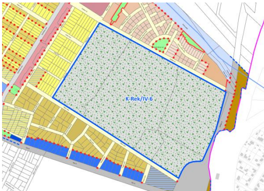
Az érintett övezet elhelyezkedése Északi kertváros városszerkezeti egységben