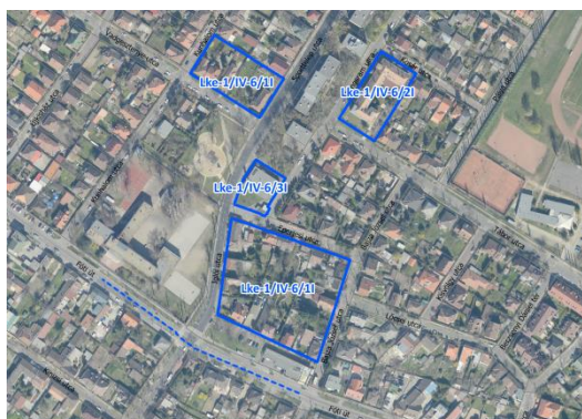
Az érintett övezetek elhelyezkedése Északi kertváros városzerkezeti egységben (légifotó)