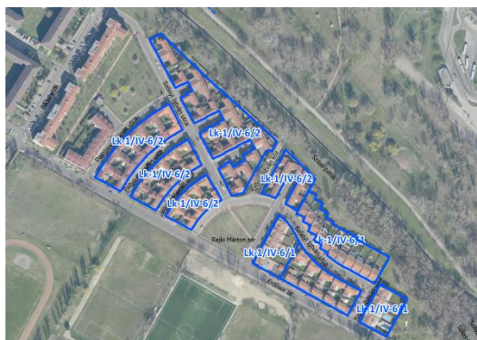
Az érintett övezetek elhelyezkedése Északi kertváros városzerkezeti egységben (légifotó)

Tekintettel arra, hogy az ezredforduló környékén beépült terület mind városzerkezeti, mind településarculati szempontból jelentős értéket képvisel Újpest, IV. kerület mindennapjaiban, és a kialakult beépítésű területeket lefedő kisvárosias lakóterületi övezetek beépítési mértékének jelen állapothoz való igazítása , valamint a hatályos ÚKVSZ vonatkozó paramétereinek továbbörökítése csak OTÉK eltérés alkalmazásával lehetséges, annak megadása indokolt.