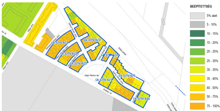
A megalapozó vizsgálat szerinti, kialakult beépítési mérték az érintett övezetek területén