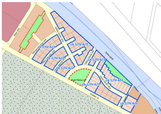
Az érintett övezetek elhelyezkedése Északi kertváros városzerkezeti egységben (övezeti struktúra)