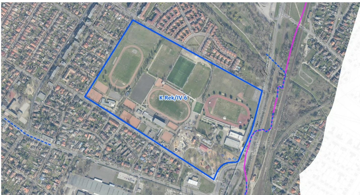
Az érintett övezet elhelyezkedése Északi kertváros városszerkezeti egységben (légifotó)

A Tábor utcai sporttelep esetében a zöldfelület legkisebb mértékének meghatározásánál alapvető szempont volt a hatályos kerületi rendezési eszköz, az ÚKVSZ paramétereinek továbbörökítése , ennek érdekében a KÉSZ-ben azzal azonos módon rögzített a zöldfelület legkisebb mértéke.