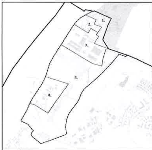
Kiemelt fejlesztési célterületek

Általános célként az alábbiak fogalmazhatók meg: